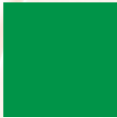
C-64311 BILLIARD GREEN