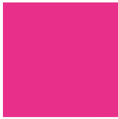
C-32043 NEON PINK